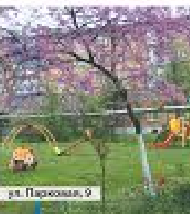
ул. Парковая, 9