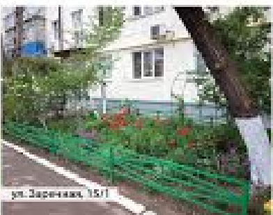
ул. Заречная, 15/1