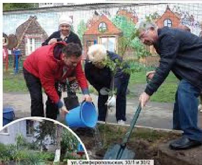
ул. Самаркандская, 30/1 и 30/2