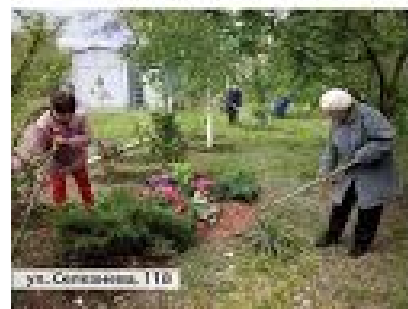
ул. Савиная, 118

Активна пора... (The text is partially cut off and difficult to read in the image.)