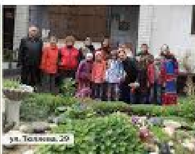
ул. Толстого, 29